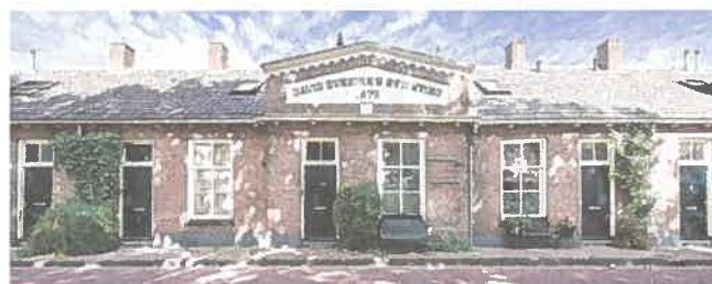
De woningen zijn anderhalve eeuw uiterlijk vrijwel niet gewijzigd. “Een teken van kwaliteit.”