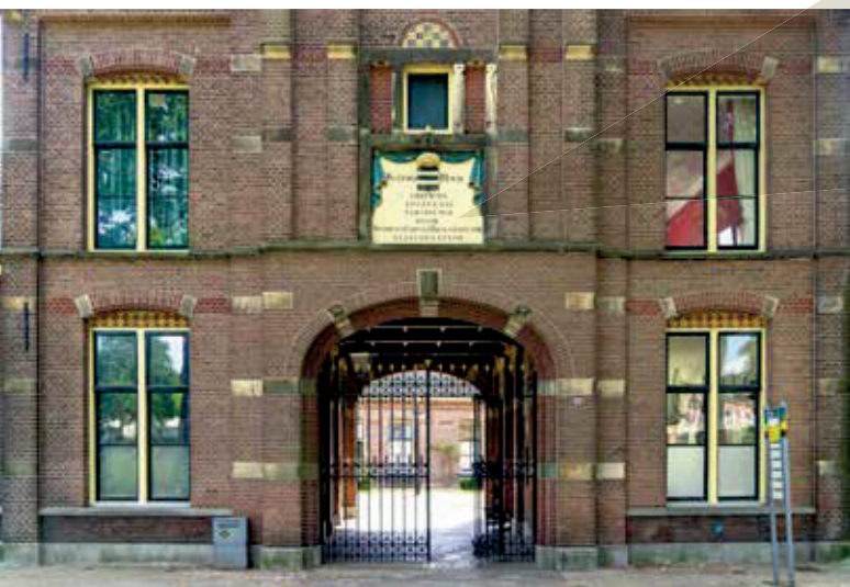
BESTUURSGEBOUW VAN DE BROEDERSCHAP

In 2026 viert de Sint Anthony Groote Broederschap een bijzonder jubileum: 575 jaar betrokkenheid bij de stad en haar inwoners. De Broederschap werd in 1451 opgericht, in een tijd waarin geloof, naastenliefde en zorg voor armen nauw met elkaar verbonden waren. Al vanaf het begin stond hulp aan mensen in kwetsbare omstandigheden centraal.